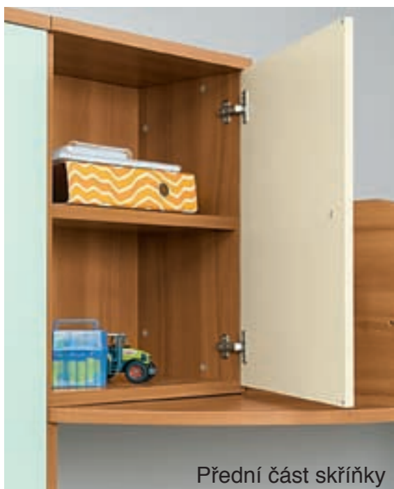
Přední část skříňky