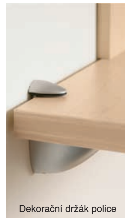
Dekorační držák police

Závěsná police je z DCP o síle 25 mm a připevňuje se ke zdi pomocí dekorativního držáku.