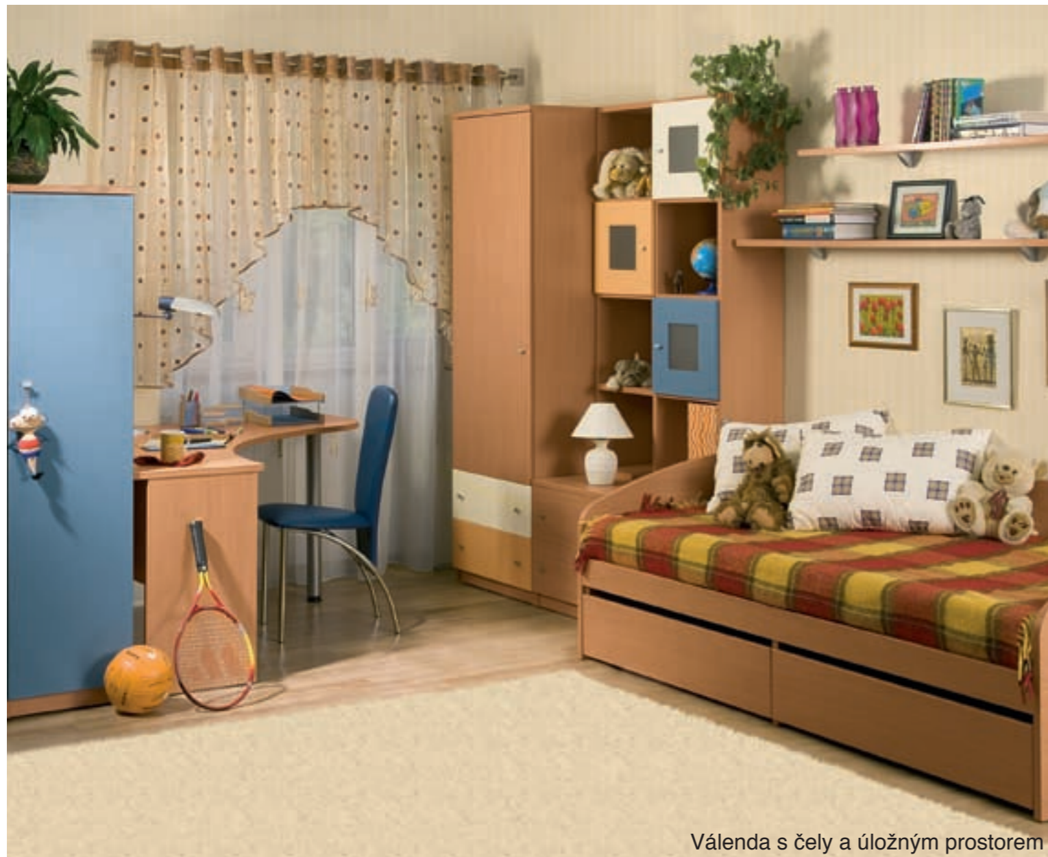
Válenda s čely a úložným prostorem