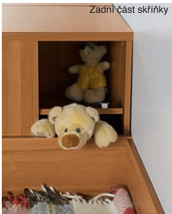
Zadní část skříňky