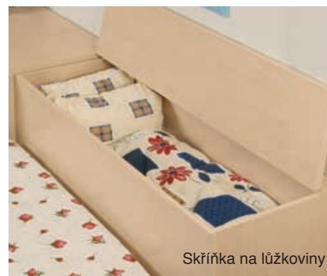
Skříňka na lůžkoviny